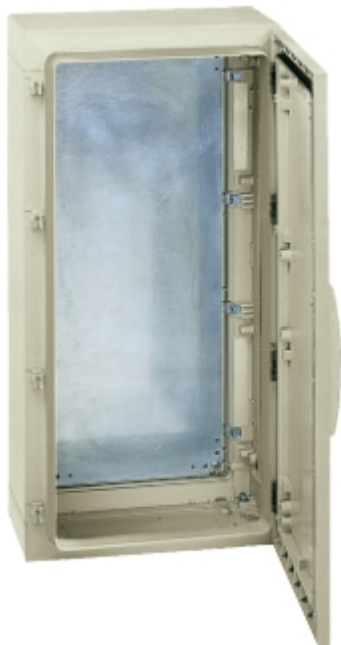
Image of product in real life situation