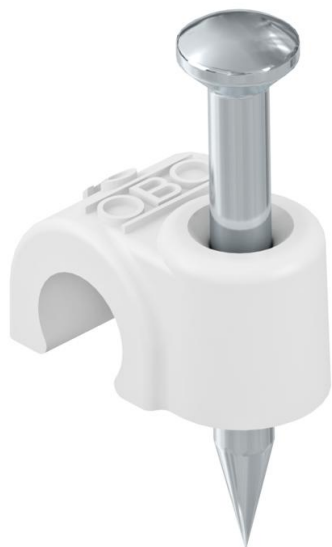
ISO-nagelclip, kort model