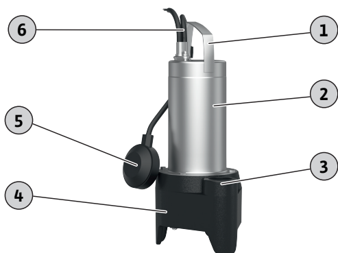
Fig. 1: Aperçu