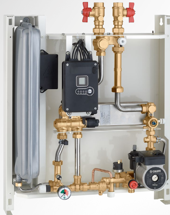
PRODUCTIE VOOR OPSLAG