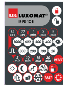
IR-PD-1C-E Art.nr.: 92077

Afmetingen: 80 x 60 x 8 mm Kleur: - Accu: Lithium 3.0 V <BR>0 mAh