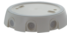
Sokkel IP54 PD4-TRIO-OB Art.nr.: 92386

Afmetingen: Ø 200 x 90 mm Slagvastheid: IK09 Behuizing: gecoate stalen korf