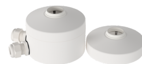
Slinger montageset PD2/3/4 OB Art.nr.: 93179

Behuizing: polycarbonaat, UV- bestendig Kleur: transparant