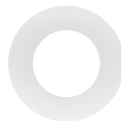
Afdekring PD9 Ø 36 mm Art.nr.: 92238

Spanning: 230 V AC ±10% Afmetingen: 50 x 23 x 8 mm Beschermingsgraad/-klasse: IP20 / Klasse II