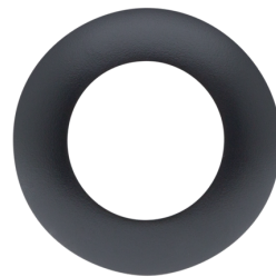
Afdekring PD9 Ø 36 mm Art.nr.: 92235

Spanning: 230 V AC ±10% Afmetingen: 38 x 12 x 26 mm Beschermingsgraad/-klasse: IP20 / Klasse II