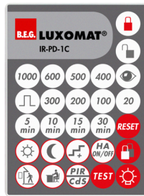
IR-PD-1C Art.nr.: 92520

Beschermingsgraad/-klasse: IP65 Behuizing: UV-bestendig Kleur: transparant