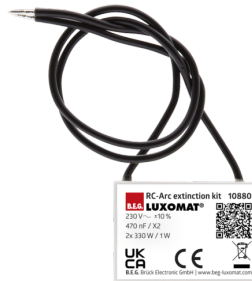
RC-filter Art.nr.: 10880

Afmetingen: 80 x 60 x 8 mm Kleur: - Accu: Lithium 3.0 V > 0 mAh