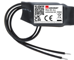
Mini RC-filter Art.nr.: 10882

Afmetingen: 80 x 60 x 8 mm Kleur: - Accu: Lithium 3.0 V > 0 mAh