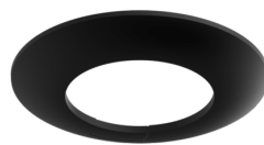
Afdekring PD3N IB Art.nr.: 93086

Afmetingen: 83 x 83 x 8 mm Behuizing: polycarbonaat, UV-bestendig Kleur: wit mat, overeenkomstig RAL9010