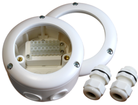
Opbouwsokkel IP65 PD4-OB IP54 Art.nr.: 92376

Afmetingen: Ø 115 x 70 mm Beschermingsgraad/-klasse: IP65 Slagvastheid: IK07