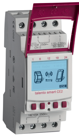
talento smart CE2