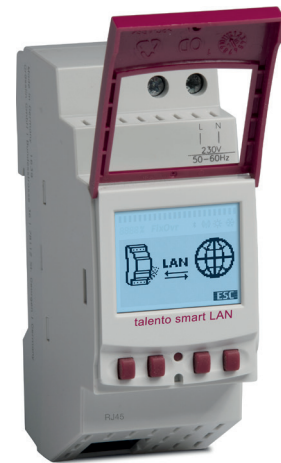
talento smart LAN