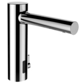
Twintronic elektronische wastafelkraan met IR- Sensor, vaste uitloop 145 mm, voeding 230V, Bluetooth adapter, chroom