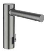
Twintronic elektronische wastafelkraan met IR- Sensor, vaste uitloop 145 mm, voeding 230V, Bluetooth adapter, PVD geborsteld roestvrij staal