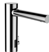
Twintronic elektronische wastafelkraan met IR- Sensor, vaste uitloop 145 mm, voeding 230V, Bluetooth adapter, chroom