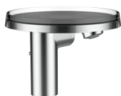
Kartell • LAUFEN wastafelmengkraan, vaste uitloop 110mm, met waste