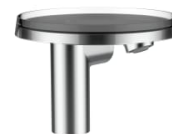
Kartell • LAUFEN wastafelmengkraan, vaste uitloop 110mm, zonder waste