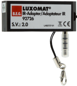
IR-Adapter voor Smartphones Art.nr.: 92726

Afmetingen: 40 x 55 x 103 mm Kleur: zwart Frequentie: 2.4 GHz ISM band, GFSK 0.2 dBm + 5.3 dBi = 5.5 dBm