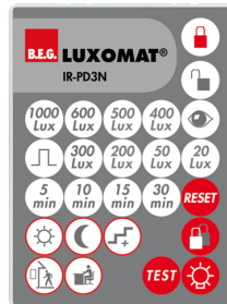
IR-PD3N Art.nr.: 92105

Afmetingen: 47 x 19 x 10 mm Bescheringsgraad/-klasse: IP20 Omgevingstemperatuur: -20 °C tot +40 °C