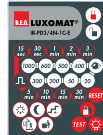
IR-PD3/4N-1C-E Art.nr.: 93110

Afmetingen: 80 x 60 x 8 mm Kleur: - Accu: Lithium 3.0 V > 0 mAh