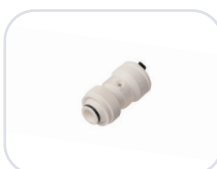
19SK Ø 16-20