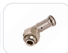
33P Ø 16