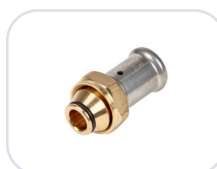
19P Ø 16-20