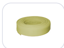
Henco 1L PEXc