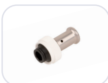
19PK Ø 16-20