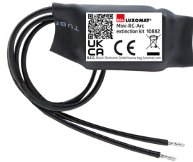
Mini RC-filter Art.nr.: 10882

Spanning: 230 V AC \pm 10\% Afmetingen: 38 x 12 x 26 mm Beschermsgraad/-klasse: IP20 / Klasse II