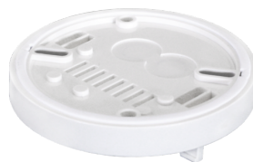
OB sokkel IP54 voor PD2- / PD4-OB Art.nr.: 92161

Afmetingen: Ø 200 x 90 mm Slagvastheid: IK09 Behuizing: gecoate stalen korf