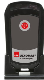
BLE-IR-Adapter Art.nr.: 93067

Spanning: 230 V AC \pm 10\% Afmetingen: 50 x 23 x 8 mm Beschermingsgraad/-klasse: IP20 / Klasse II