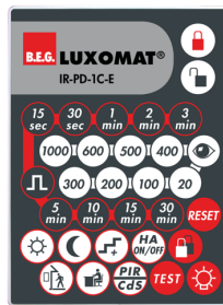
IR-PD-1C-E Art.nr.: 92077

Afmetingen: 80 x 60 x 8 mm Kleur: - Accu: Lithium 3.0 V <BR>0 mAh