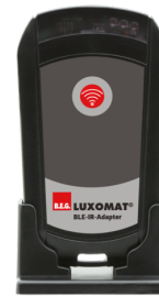
BLE-IR-Adapter Art.nr.: 93067

Spanning: 230 V AC \pm 10\% Afmetingen: 50 x 23 x 8 mm Beschermingsgraad/-klasse: IP20 / Klasse II