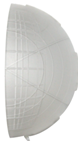
Afdeklamellen PD4 Art.nr.: 92313

Afmetingen: Ø 200 x 90 mm Slagvastheid: IK09 Behuizing: gecoatete stalen korf