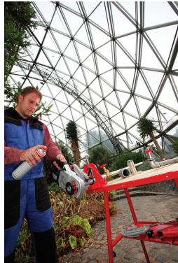
MamfileID: 30538 4941_rohrschaubstock_aw.tif