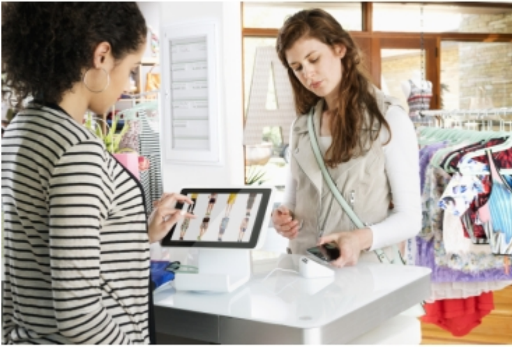
Image of product in real life situation