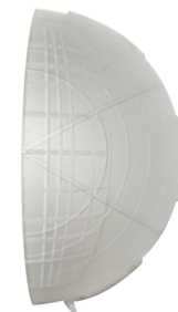
Afdeklamellen PD4 Art.nr.: 92313

Afmetingen: 101 x 101 x 11.8 mm Behuizing: polycarbonaat, UV- bestendig Kleur: zuiver wit mat, overeenkomstig RAL9010