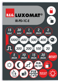
IR-PD-1C-E Art.nr.: 92077

Afmetingen: 80 x 60 x 8 mm Kleur: - Accu: Lithium 3.0 V <BR>0 mAh