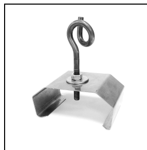
3100246 Beugel voor snelle montage aan plafond van roestvrij staal + haak (50 stuks)