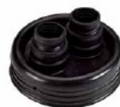
HFMAN125 - Embout en caoutchouc.