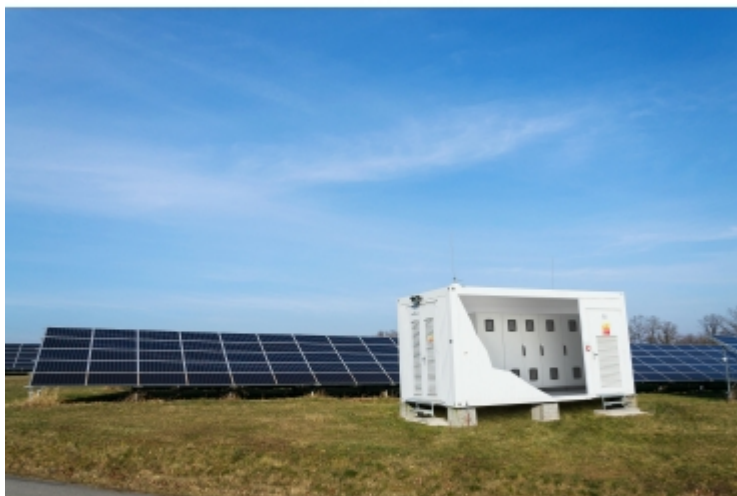
Image of product in real life situation