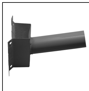
14077796 Gegalvaniseerde stalen wandsteun , met cataphorese polyester poeder afwerking AN-g6 / Antraciet

Om een constante actualisering van haar producten te bevorderen, behoudt PERFORMANCE in LIGHTING zich het recht voor om zonder voorafgaande kennisgeving, wijzigingen aan te brengen. Daarom is het altijd aan te raden om de laatste versie te lezen die op de website www.performanceinlighting.com is gepubliceerd. Geleverde lumenoutput en stroomverbruik, inclusief verliezen, zijn onderhevig aan een tolerantie van +/-7%. Tenzij anders vermeld, gelden de waarden bij een omgevingstemperatuur van 25°C. De garantievoorwaarden zijn beschikbaar op https://www.performanceinlighting.com/qr/company/led-warranty