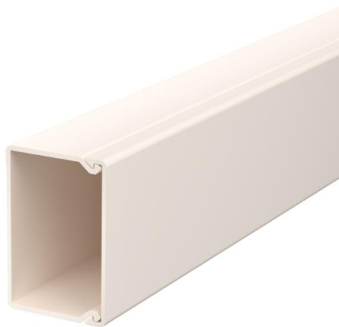
Kanaal en deksel, met bodemperforatie.