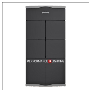
14469820 Afstandsbediening met vier configureerbare toetsen