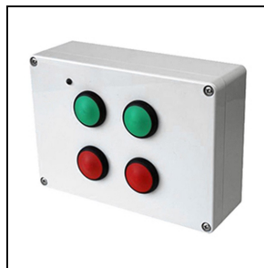
14477420 Draadloze knop met vier configureerbare toetsen

Om een constante actualisering van haar producten te bevorderen, behoudt PERFORMANCE iN LIGHTING zich het recht voor om zonder voorafgaande kennisgeving, wijzigingen aan te brengen. Daarom is het altijd aan te raden om de laatste versie te lezen die op de website www.performanceinlighting.com is gepubliceerd. Geleverde lumenoutput en stroomverbruik, inclusief verliezen, zijn onderhevig aan een tolerantie van +/-7%. Tenzij anders vermeld, gelden de waarden bij een omgevingstemperatuur van 25°C. De garantievoorwaarden zijn beschikbaar op https://www.performanceinlighting.com/qr/company/led-warranty