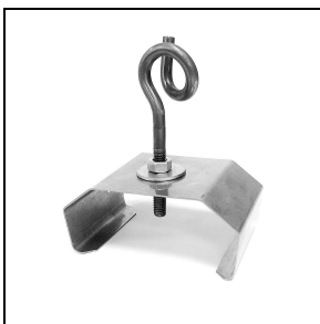
3100245 Beugel voor snelle montage aan plafond van roestvrij staal + haak (2 stuks)