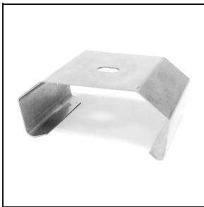
3100243 Beugel voor snelle montage aan plafond van roestvrij staal (2 stuks)