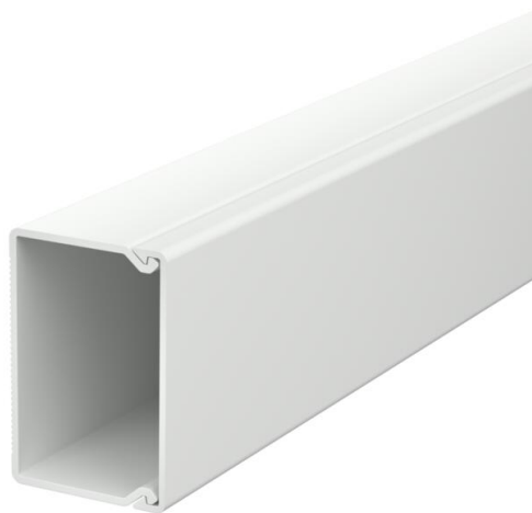
Kanaal en deksel, met bodemperforatie.