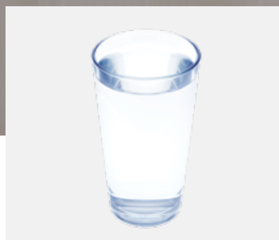
Met SpiroTrap MB3