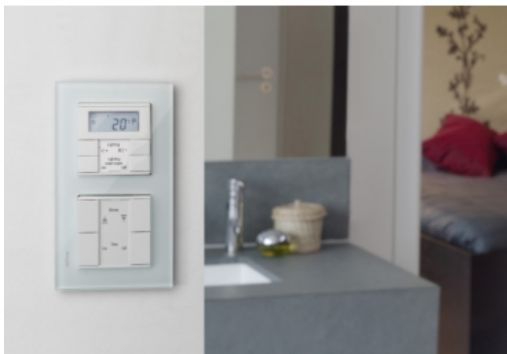
Image of product in real life situation