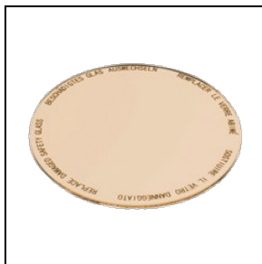
8435962 Levensmiddelenfilter voor bakkerijproducten