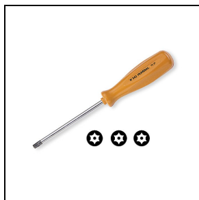
310514 Tool TORX

Om een constante actualisering van haar producten te bevorderen, behoudt PERFORMANCE iN LIGHTING zich het recht voor om zonder voorafgaande kennisgeving, wijzigingen aan te brengen. Daarom is het altijd aan te raden om de laatste versie te lezen die op de website www.performanceinlighting.com is gepubliceerd. Geleverde lumenoutput en stroomverbruik, inclusief verliezen, zijn onderhevig aan een tolerantie van +/-7%. Tenzij anders vermeld, gelden de waarden bij een omgevingstemperatuur van 25°C. De garantievoorwaarden zijn beschikbaar op https://www.performanceinlighting.com/qr/company/led-warranty