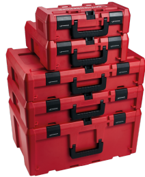
MamfileID: 30117 4056_rocase_stacked.png