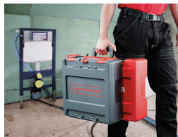
MamfileID: 30119 4058_motiv_powertools_cmyk.tif