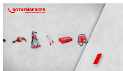
MamfileID: 30120 4059_7240_Rocase_1080.mp4