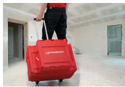
MamfileID: 30118 4057_motiv_rocase_cmyk.tif