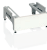
Vloerframe WPV (60x60)