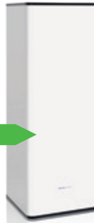
WPV 240L (60x60)