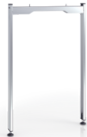
WPU-ondersteuning WPV (50x50) (breed frame)