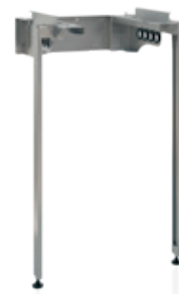
Muurframe Ext WPV (60x60)