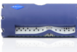
Regelunit Autotemp 12 groeps | Artikelnummer: 536-5100