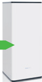
WPV 200L (60x60)