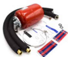
Set flexibele leidingen voor aansluitingen bron of afgiftesysteem incl. isolatie en drukexpansievat