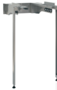
Muurframe Staand WPV (60x60)

De voorraadvaten van het type WPV (60x60) met 150 liter en grotere inhoud kunnen op de WPU 6G met laag tussenstuk (artikelnummer: 04-00218) en hoog tussenstuk (artikelnummer: 04-00219) geplaatst worden. Wanneer het warmtepompvoorraadvat naast de WPU wordt geplaatst, is hiervoor het "vloerframe" beschikbaar. Als alternatief kunnen deze vaten op een muurframe boven de warmtepomp of bijvoorbeeld een wasmachine worden geplaatst. Om het vat op het "Muurframe Staand" 220mm van de wand af te kunnen plaatsen, bijvoorbeeld voor de doorvoer van kabels of leidingen, kan het "Muurframe Ext WPV" worden toegepast. Bij montage op het "Muurframe WPV" dient de wand voldoende sterk te zijn om het gewicht van het met water gevulde vat te kunnen dragen. De 240L en 270L vaten dienen altijd ondersteuning d.m.v. een "Muurframe Staand" te hebben bij montage aan een muur. De warmtepomp kan uitsluitend naast het frame worden geplaatst. Bij 50x50 smal frame (artikelnummer: 04-00157) kan de warmtepomp uitsluitend naast het frame worden geplaatst. Bij type 04-00209 is tevens plaatsing van de WPU onder het frame mogelijk.