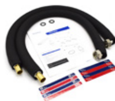
Set flexibele leidingen voor aansluitingen bron of afgiftesysteem incl. isolatie

Bij het maken van verbindingen in het bronsysteem dient rekening te worden gehouden met het risico op spanningscorrosie als gevolg van een combinatie van vocht en het toegepaste isolatiemateriaal.