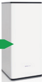
WPV 150L (60x60)