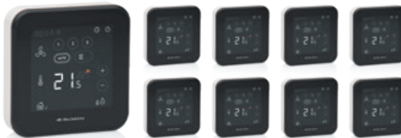
Spider WP Klimaatthermostaat | Artikelnummer: 03-00476

De Autotemp regelingen verzekeren de warmtepomp tevens van voldoende debiet om warmte of koeling kwijt te kunnen zonder veelvuldig aan of uit te hoeven schakelen. Dit heeft een positief effect op het verbruik en de levensduur van de warmtepomp. Toepassing van andere zone-regelingen is daarom binnen de garantievoorwaarden niet toegestaan.