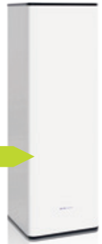
WPV 270L (60x60)