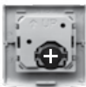
Fig. 3 Batterij in afstandsbediening 15RF

Wanneer de led indicatie oranje knippert, of de bediening niet meer reageert dient u de batterij te vervangen. Om de bediening te verwijderen drukt u de drukknop in onder het wandframe en maakt u een scharnierende beweging. Vervang de batterij met de plus kant naar u toe. Klik met een scharnierende beweging de bediening weer op het wandframe vast.