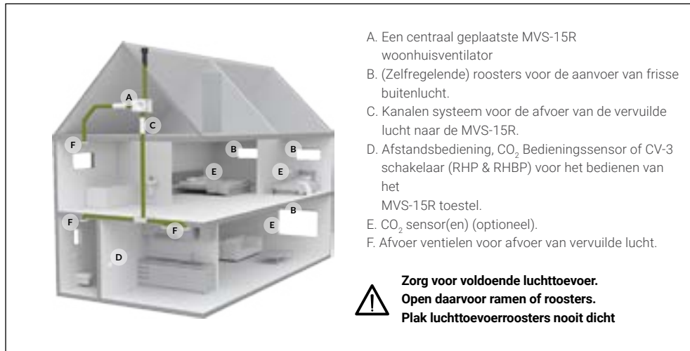
Fig. 1 Overzicht ventilatiesysteem MVS-15R