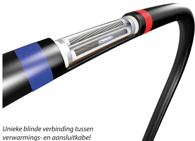
Unieke blinde verbinding tussen verwarmings- en aansluitkabel