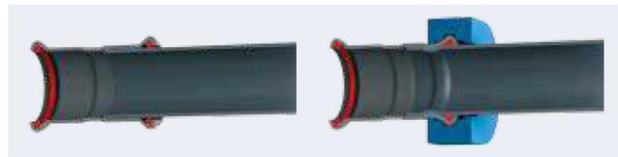
Fig. 1: coupe transversale avant et après le sertissage

Compte tenu des propriétés de matériau du tube et du raccord à sertir, ceux-ci se déforment simultanément et uniformément en 2 endroits sous l'influence des mordaches ou des chaînes de la pince à sertir. Une première déformation à l'arrière de la collerette de sertissage assure la résistance à la traction de l'assemblage du raccord à sertir et du tube. Une deuxième déformation en 3 directions au droit de la collerette de sertissage et donc de la bague d'étanchéité assure un assemblage étanche du raccord à sertir et du tube. La coupe transversale (figure 2) présente le raccord avant et après le sertissage.