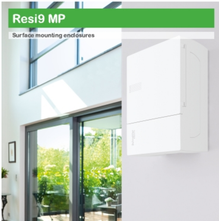
Image of product in real life situation