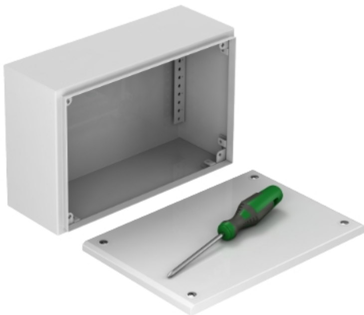
Image of product in real life situation