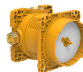
Simibox, inbouwsysteem voor bad- en douchemengkraan HF574007000000