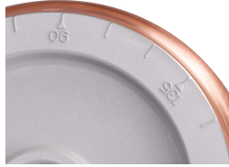
MamfileID: 160649 1000001559_robend_4000_d01.tif