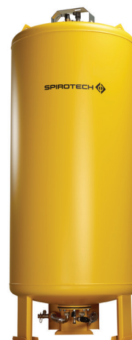
Image du produit