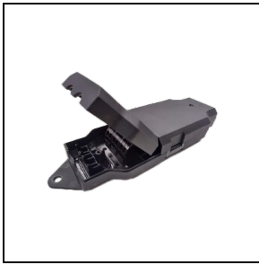
3122585 Externe Casambi-module BK-81 / Zwart