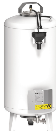
Image du produit