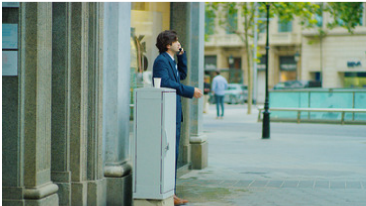
Image of product in real life situation