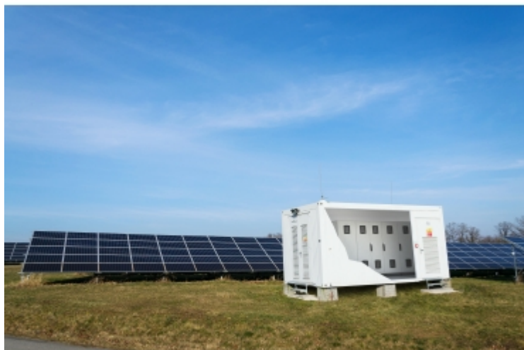
Image of product in real life situation