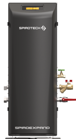
Image du produit