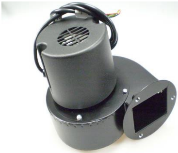
GA4510 Airflow 45BTFR WSP/URS Type 11-35