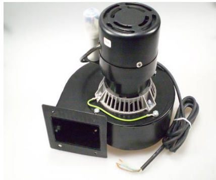
GA4520 Airflow 52BTXLHT WSP/URS Type 100 SIT From 01-09-2001