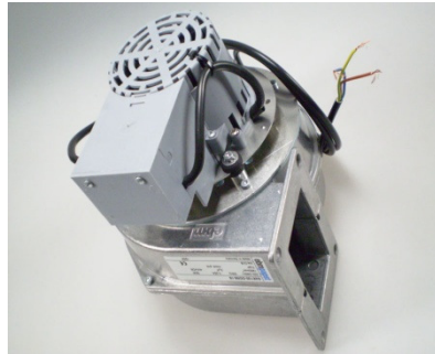
GA4540 EBM G2E 120 DC18 WSP/URS Type 41-70