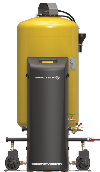
Image du produit