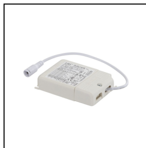
19-02566 Driver 36 W 1-10 V push