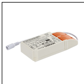
19-02565 Driver 36 W DALI